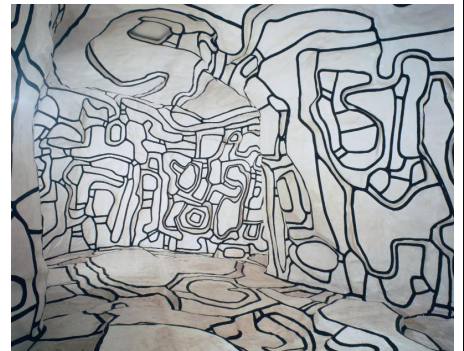
Jean Dubuffet, Le jardin d'hiver , 1970, Installation, Centre Pompidou, Paris