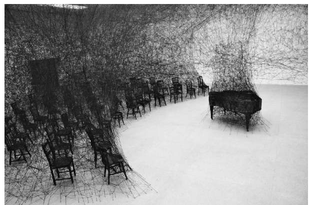
Chiharu Shiota, In Silence , 2008, Installation insitu de fil noir, Kanagawana Art Foudation, Japon

La compétence que tu développes plus précisément dans ce travail est : «Etablir des liens avec les artistes» Grâce à ce tableau de progression, tu peux te situer et ainsi améliorer ton travail (Entoure le niveau choisi).