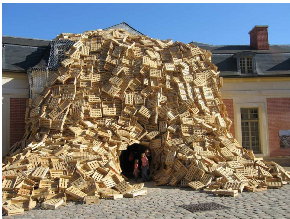
Tadashi Kawamata, Gandamaison , 2015, installation de cagette, Versailles