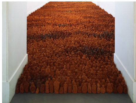
Anthony Gormley, FIELD FOR THE BRITISH ISLES , 1993, installation de figures en terre, Irish Museum of Modern Art, Dublin,