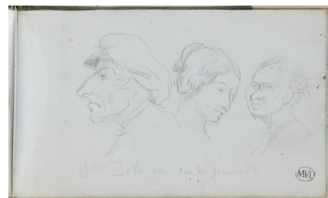
Jean-Baptiste CARPEAUX Carnet de croquis : trois études de visages Musée des Beaux-Arts, Valenciennes