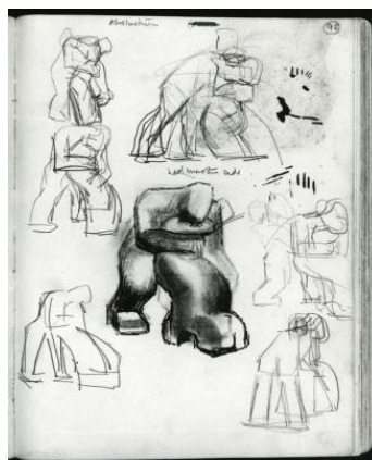
Henry MOORE Figure Studies 1922-24 Henry Moore Foundation Much Hadham, R-Uni