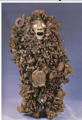
Fétiche zaïre bois et matériaux 60 cm