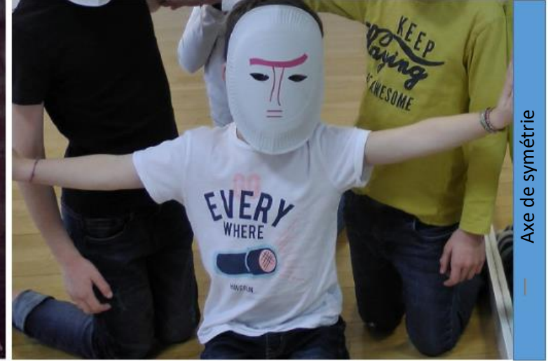
Axe de symétrie