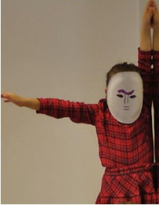
Axe de symétrie