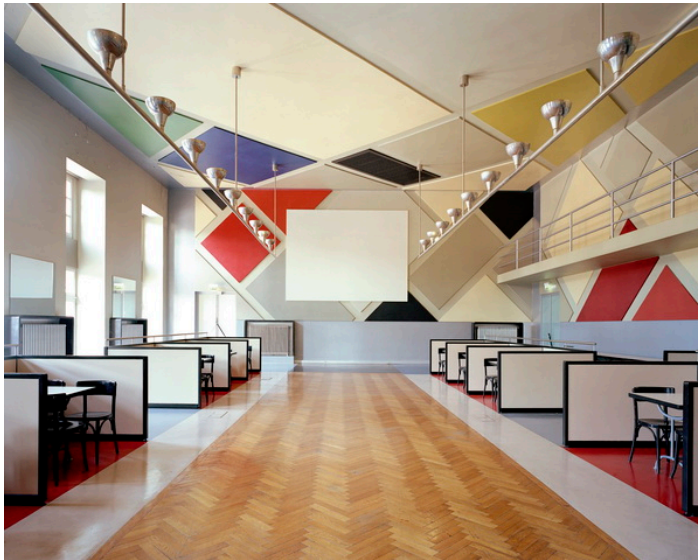
Sophie TAEUBER-ARP (1889-1943) , Jean ou Hans Arp (1886-1966), Théo van Doesburg (1883-1931), L'Aubette , 1926-1928, aménagement et décors d'un complexe de loisirs (café, restaurant, brasserie, salon de thé, ciné-bal, caveau-dancing, salle des fêtes, etc.) sur quatre niveaux (caveau, rez-de-chaussée, entresol et étage), Strasbourg. Premier étage restitué de 1985 à 2006. Classée au titre des Monuments Historiques