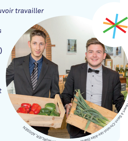
Drive fermier, Lycée Jacques Prévert à Saint-Morlier, ADOSEN

Isabelle, principale d'un collège (Direction, mars 2018)