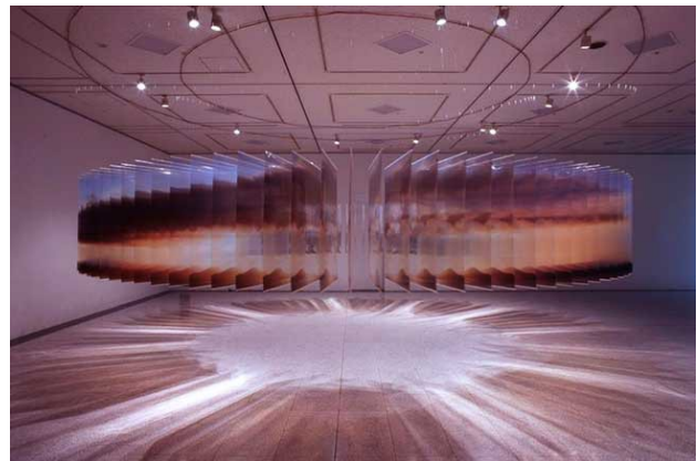
Nobuhiro Nakanishi Layered Drawings