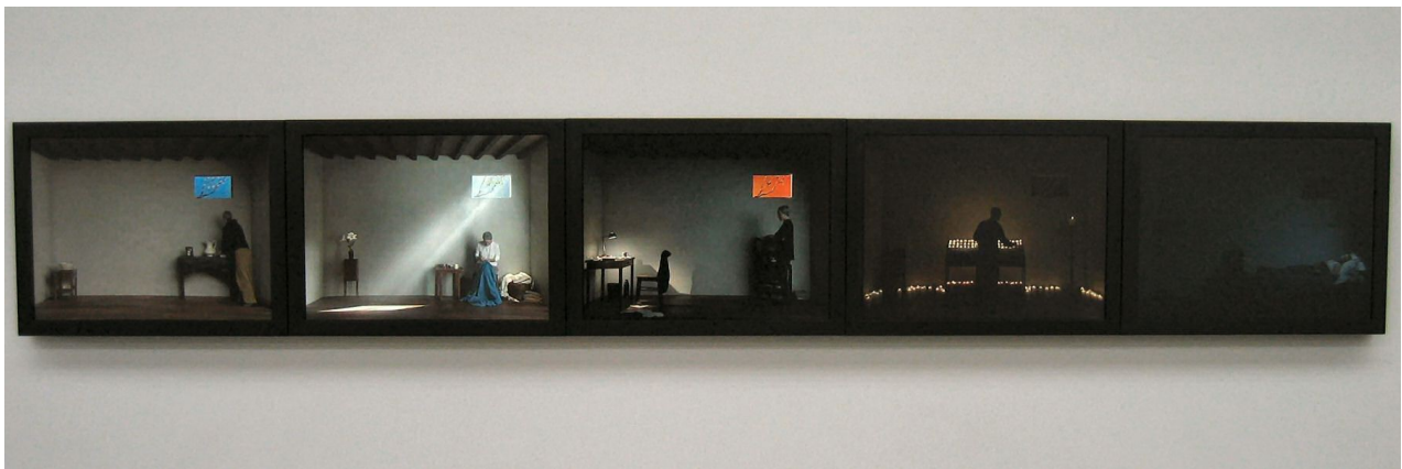
Bill VIOLA Catherine's room 2001