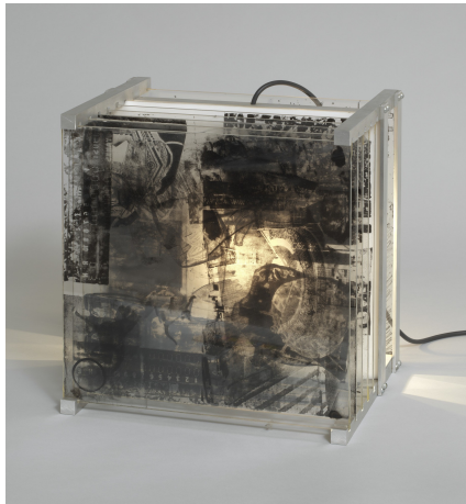
Robert Rauschenberg Shades 1964