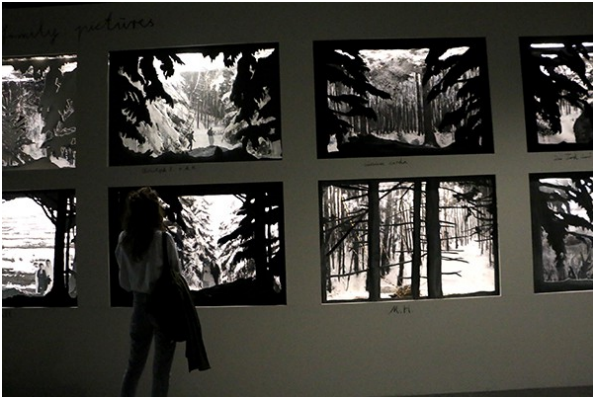
Anselm KIEFER Family Pictures 2013-17